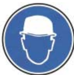
Protection obligatoire de la tête