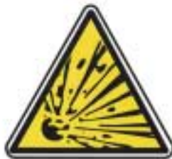
Matières explosives risque d'explosion