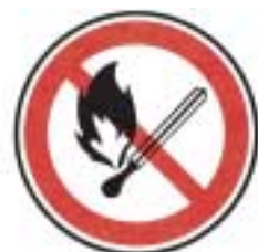
Flamme nue interdite et défense de fumer