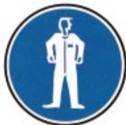
Protection obligatoire du corps