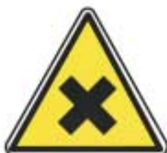
Matière nocives ou irritantes (*)

(*) Le fond de ce panneau peut être exceptionnellement de couleur orangée si cette couleur se justifie par rapport à un panneau similaire existant concernant la circulation routière.