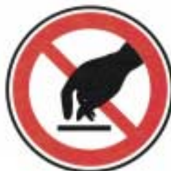
Ne pas toucher