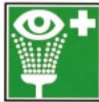
Rinçage des yeux