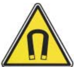
Champ magnétique important