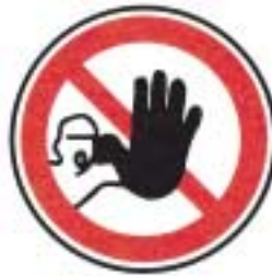
Entrée interdite aux personnes non autorisées