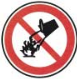
Défense d'éteindre avec de l'eau