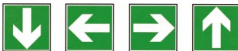
Direction à suivre (signal d'indication additionnel aux panneaux ci-dessus)