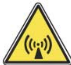
Radiations non ionisantes