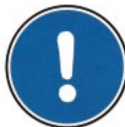
Obligation générale (accompagnée le cas échéant d'un panneau additionnel)