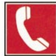
Téléphone pour la lutte contre l'incendie