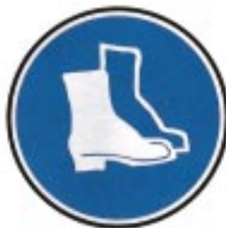
Protection obligatoire des pieds