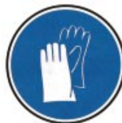
Protection obligatoire des mains