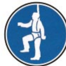
Protection individuelle obligatoire contre les chutes