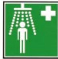
Douche de sécurité