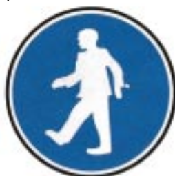
Passage obligatoire pour piétons