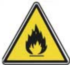
Matières inflammables de haute température (1)