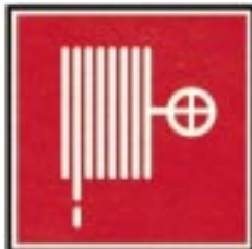
Lance à incendie