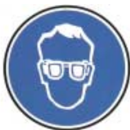
Protection obligatoire de la vue