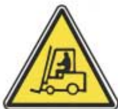
Véhicules de manutention