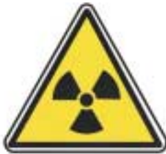
Matières radioactives radiations ionisantes