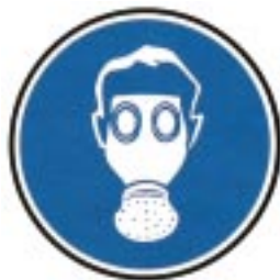
Protection obligatoire des voies respiratoires