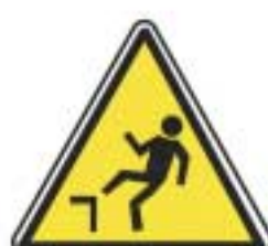
Chute avec dénivellation