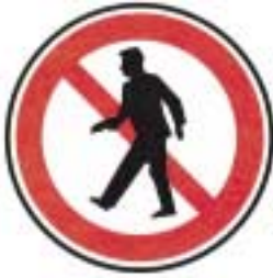
Interdit aux piétons