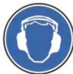
Protection obligatoire de l'ouïe