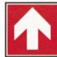
Direction à suivre (signal d'indication additionnel aux panneaux ci-dessus)