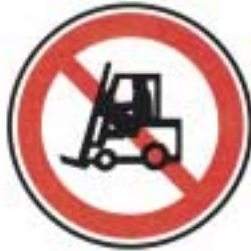
Interdit aux véhicules de manutention