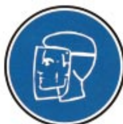
Protection obligatoire de la figure