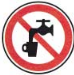
Eau non potable