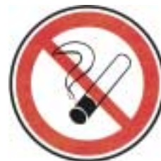
Défense de fumer