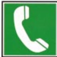
Téléphone pour le sauvetage et premiers secours