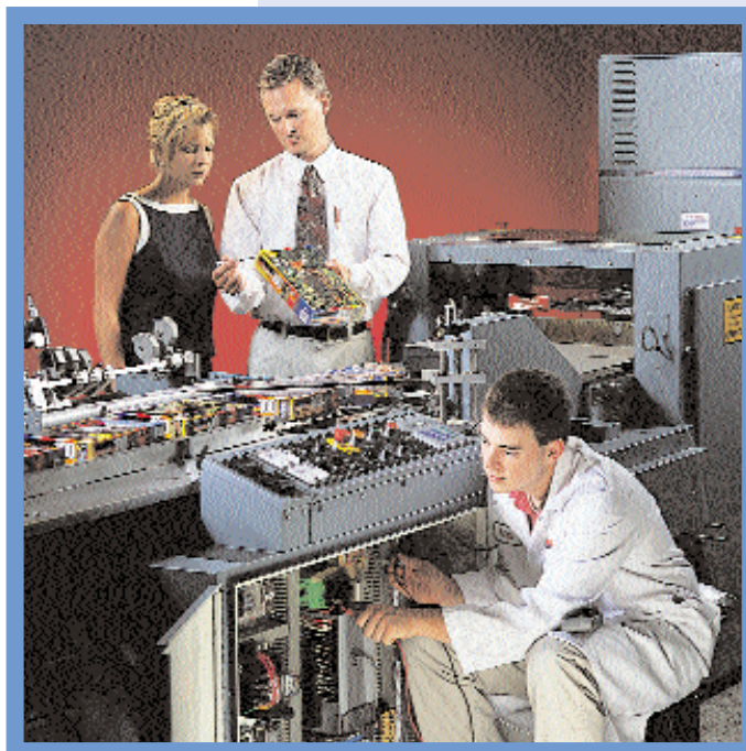
Nous travaillons avec vous pour identifier, développer et entretenir l'équipement qui répond au mieux à vos besoins spécifiques de conditionnement.