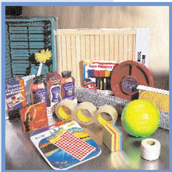
Seuls les films rétractables Cryovac offrent la souplesse et la performance nécessaires.