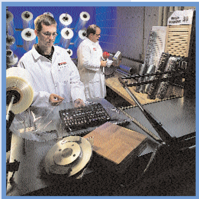
Des spécialistes choisissent les matériaux adaptés à chaque cas.