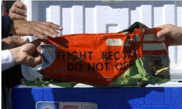
La boîte noire du Boeing 737 qui s'est écrasé à Charm el-Cheikh, est retrouvée le 17 janvier 2004

Créé le 15.06.09 à 15h43 | Mis à jour le 15.06.09 à 18h20 | 7