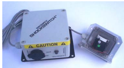
Boîtier SC1060 avec capteur de choc déporté

- Le SC1060: Basé sur le même principe, ce contrôleur de choc plus simple déclenche juste une alarme sonore qui continuera à sonner jusqu'à ce qu'un responsable vienne stopper la sonnerie avec une clé RESET. Cela permet de connaître en temps réel les chocs qui viennent d'avoir lieu. Un contact sec est également disponible pour déclencher autre chose (vitesse escargot, gyrophare, etc...) Plus économique et très facile d'utilisation, il est idéal pour les petits parcs de chariots.