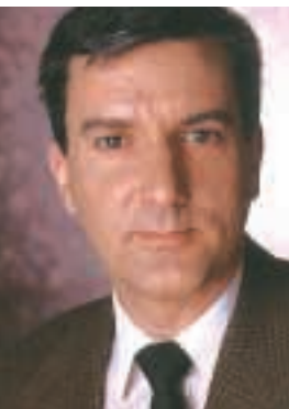
par MICHEL GAGNON Conseiller en hygiène industrielle, Auto Prévention

L'élément essentiel, c'est la béquille. Il n'y a qu'une seule façon d'empêcher la remorque de pencher vers l'avant lorsqu'on la charge : installer une béquille avec embase large (comme celle-ci) à l'avant de la remorque ou une béquille à chacun des coins de la remorque.