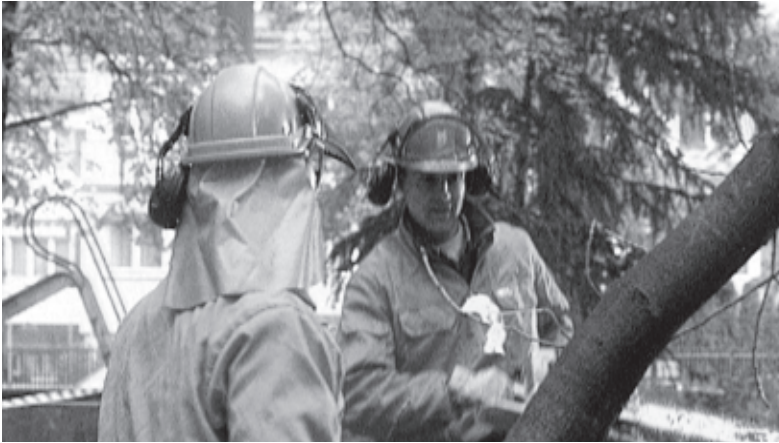
Fig. 6 Montrer et expliquer ce qu'il faut faire.