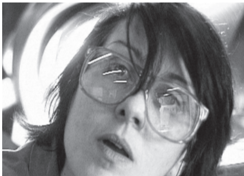
Fig. 2 Les nouveaux arrivants sont souvent submergés par un flot d'informations. Trop d'informations sèment le doute et augmentent le risque d'accident.