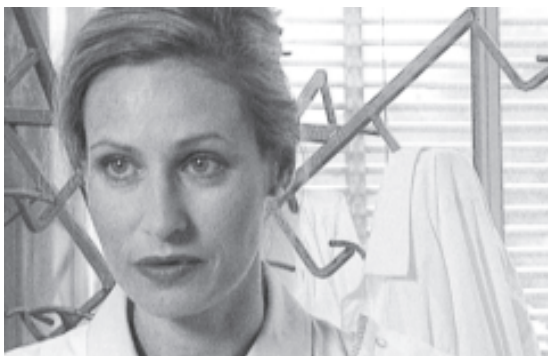
Fig. 3 Informez le personnel de l'arrivée des nouveaux. Tout est plus simple lorsqu'on se connaît.

Fixez les tâches de chacun et déterminez les préparatifs qui sont nécessaires pour assurer un bon début (par ex. préparer le poste de travail et les équipements de protection individuelle). Si vous associez vos collaborateurs à l'établissement du programme, ceux-ci se mettront plus facilement à la place du nouveau et contribueront à la réussite de l'initiation. La liste de contrôle «Formation des nouveaux collaborateurs» (réf. Suva 67019.f) vous permet de vérifier systématiquement si vous n'avez rien oublié d'important pour l'initiation.