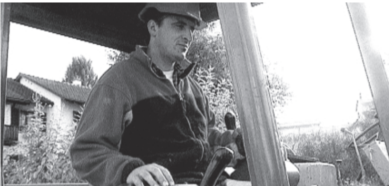
Fig. 5 Même ce machiniste expérimenté doit se familiariser avec le nouvel engin.