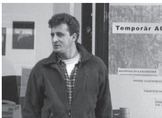
Fig. 1 Les travailleurs temporaires sont toujours des «nouveaux». Leur risque d'accident est nettement plus élevé que celui des collaborateurs engagés à poste fixe qui exécutent les mêmes travaux.